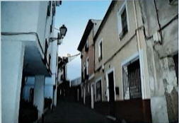
Tramo medio de la calle de las Damas. En la fotografía actual se observa la pérdida de su arquitectura tradicional.