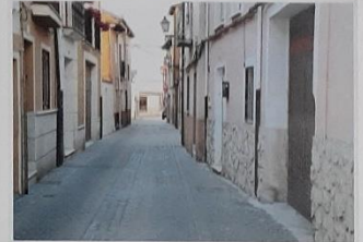
Das perspectivas, ascendente y descendente, de la calle San Lázaro. En la segunda se puede ver perfectamente el antiguo adosado de casas redondeo que tenía Peñafiel.