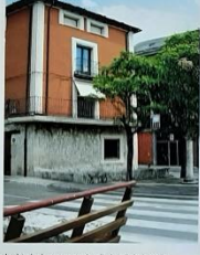
En la plaza desde se conserva la casa de la Plaza con la escultura de la Constitución en altura así de los siglos contemporáneos finales del siglo XIX. En su lugar se volvió después se muestra que conserva el subsuelo de Cádiz.