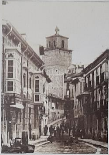
Los calles Empedrado y Reyes; al fondo de la primera imagen se ven los antiguos casales, donde dicen que estaba situada la sinagoga de la aljama hebrea de la villa.