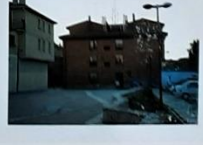
Barriada de La Laguna. Restos de la muralla junto a la carretera de Valladolid con un transformador de eléctrico hoy día eliminado.