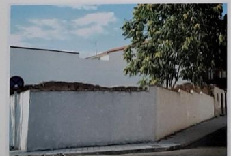
En la Avenida de la Constitución se hallaba "Casa Tado", famoso taller en los años 1950-60. Y la casita de "La Puchola". En su lugar, hoy sólo existe un solar.