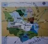
Mapas de la comarca de Peñafiel Siglo XVIII, XIX, XX y XXI.