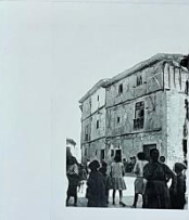
La fotografía antigua de la plaza del Concejo, tomada en los años veinte del pasado siglo, fue utilizada para construir una réplica aproximada. La Casa de la Iglesia que se conserva en el Pueblo Español de Herrera es como ejemplo de arquitectura popular similar.