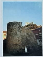
Restos de la muralla en la barriada de La Laguna.