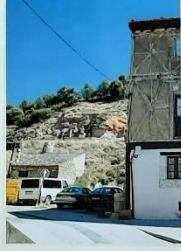
Terres edificio, hoy desaparecido, del conjunto de casas tradicionales de la plaza del Concejo.