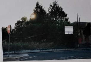
En el cruce de la carretera de Aranda con la carretera de Pousquera atraves el centro histórico (señala un domicilio para el titular) hasta que fue derribado al trasladar el servicio a otra ubicación.