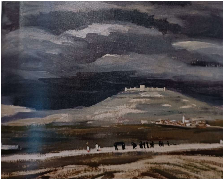
Peñaflor - sepelio en la llanura

déco tuvo una proyección importante en las artes aplicadas, como la tapicería, moda y joyería.