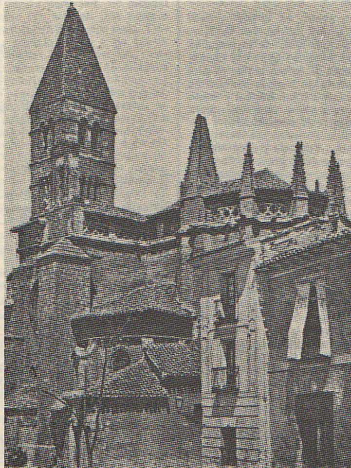
VALLADOLID.—Torre de Santa María La Antigua

Para complemento de este art., ponemos á continuacion el