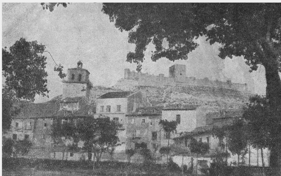
Vista desde los jardines de la Judería