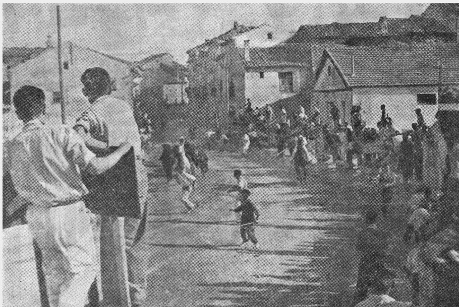
Una escena del encierro