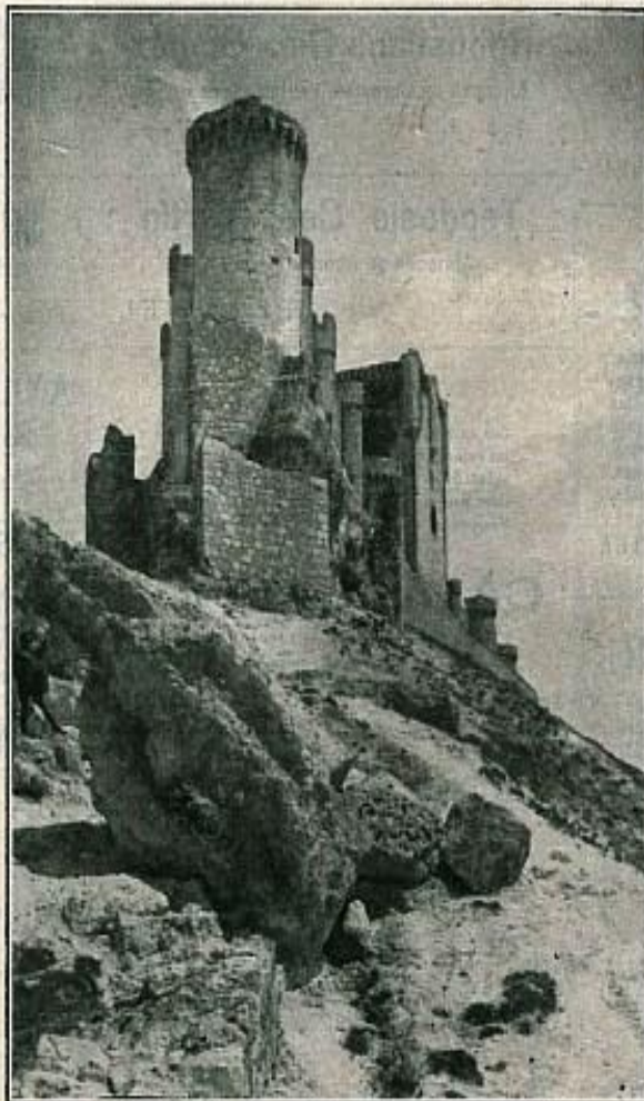
VISTA DE SU FAMOSO CASTILLO

Además del castillo, reseñado en otro lugar de la Guía, posee Peñafiel monumentos de indiscutible interés. Ocupa el primer lugar la Iglesia de San Pablo, que perteneció al convento de dominicos que erigiera el infante don Juan Manuel. Fué