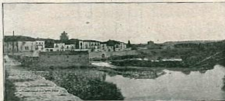
VISTA GENERAL DE PEÑAFIEL