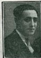
Sr. Jefe de Clínica