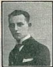
Sr. Juez de Instrucción