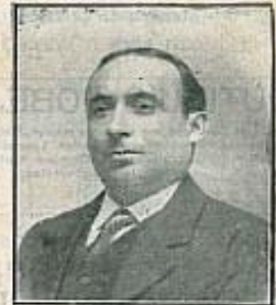
Secretario del Ayuntamiento