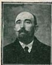
Sr. Director de Enseñanza