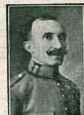
Teniente de la Guardia Civil