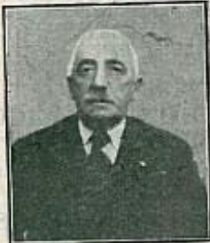
D. Angel Escribano Alcalde de Peñafiel