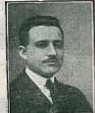
Sr. Presidente del Círculo Católico